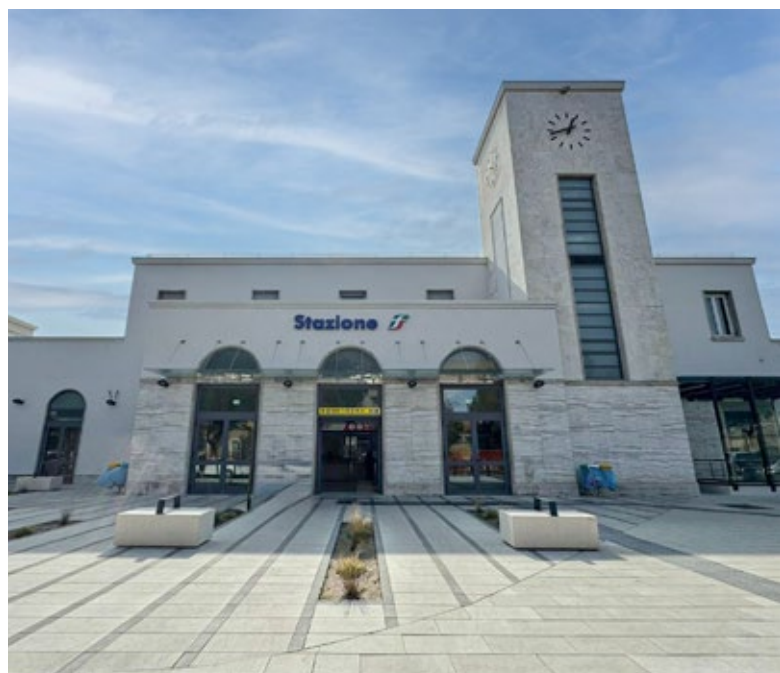
Sopra: la piazza della stazione di Pesaro Sotto a sinistra: vista eseterna della Velostazione Sotto a destra: il Cubo parcheggio bici automatizzato h24

Pesaro ha la sua Velostazione. L'ex officina locomotive vicino alla stazione ferroviaria è stata trasformata in un nuovo spazio dedicato alla mobilità sostenibile, dov'è possibile noleggiare, riparare o depositare una bicicletta. «Un progetto innovativo che ci rende ancor più