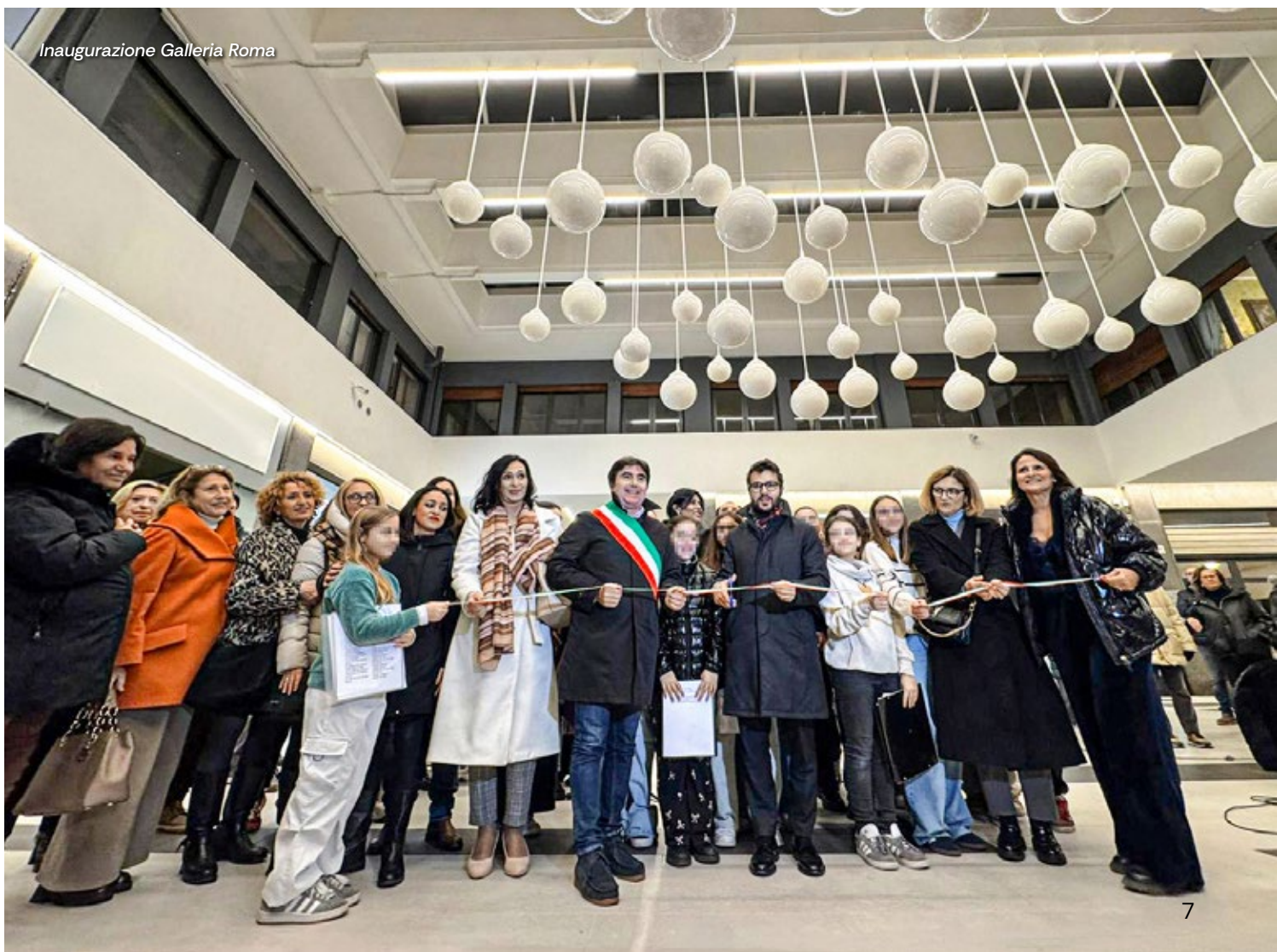
Inaugurazione Galleria Roma