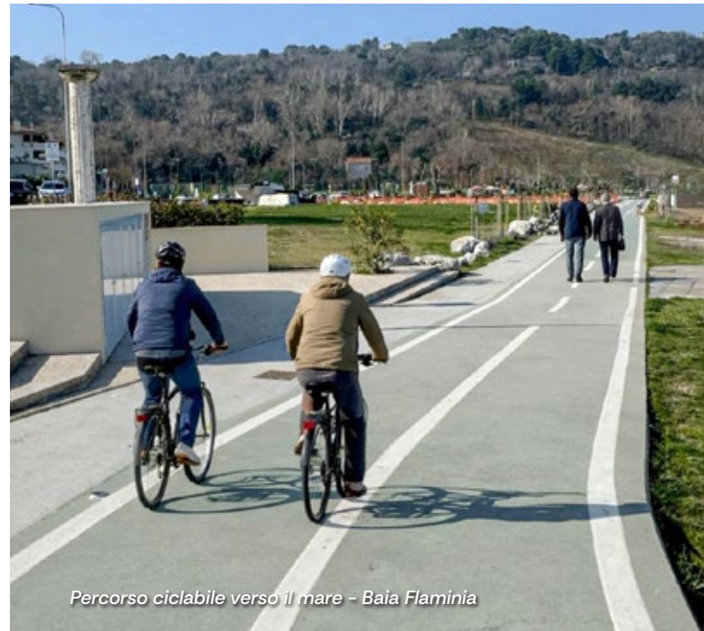
Percorso ciclabile verso il mare - Baia Flaminia

I lavori realizzati hanno previsto la riqualificazione e la messa in sicurezza del percorso ciclopeditonale che da viale Parigi porta a Lido Pavarotti, attraverso la ricollocazione del Monumento ai Tre Martiri; la demolizione della vecchia rampa usata impropriamente da auto e furgoni e la creazione di un nuovo accesso alla pista ciclopeditonale riservato ai mezzi di emergenza hanno reso l'area più ordinata e decorosa; un nuovo camminamento in cemento armato che costeggia la ciclabile; la sistemazione del verde pubblico; una nuova e bellissima passerella in legno che collega alla battigia per consentire un migliore accesso a tutti coloro che frequentano la spiaggia libera e una fruizione dell'area anche alle persone con disabilità e famiglie con carrozzine. Nel progetto che il Comune di Pesaro si è aggiudicato insieme a Ente Parco San Bartolo, Lega Navale di Pesaro e Cooperativa La Macina Terre Alte, rientra anche l'acquisto di una carrozzina che permette alle persone con disabilità di recarsi in mare (è possibile richiederla alla Scuola di Mare della Lega Navale).