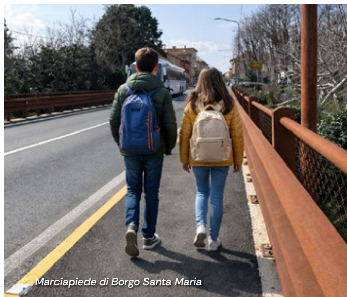
Marciapiede di Borgo Santa Maria

Un intervento concreto che risponde alle esigenze dei cittadini, migliorando la sicurezza e la fruibilità di un'arteria importante per Borgo Santa Maria. È un chiaro esempio di come la collaborazione tra Comune e Provincia produca risultati tangibili, capaci di incidere positivamente sulla qualità della vita dei residenti