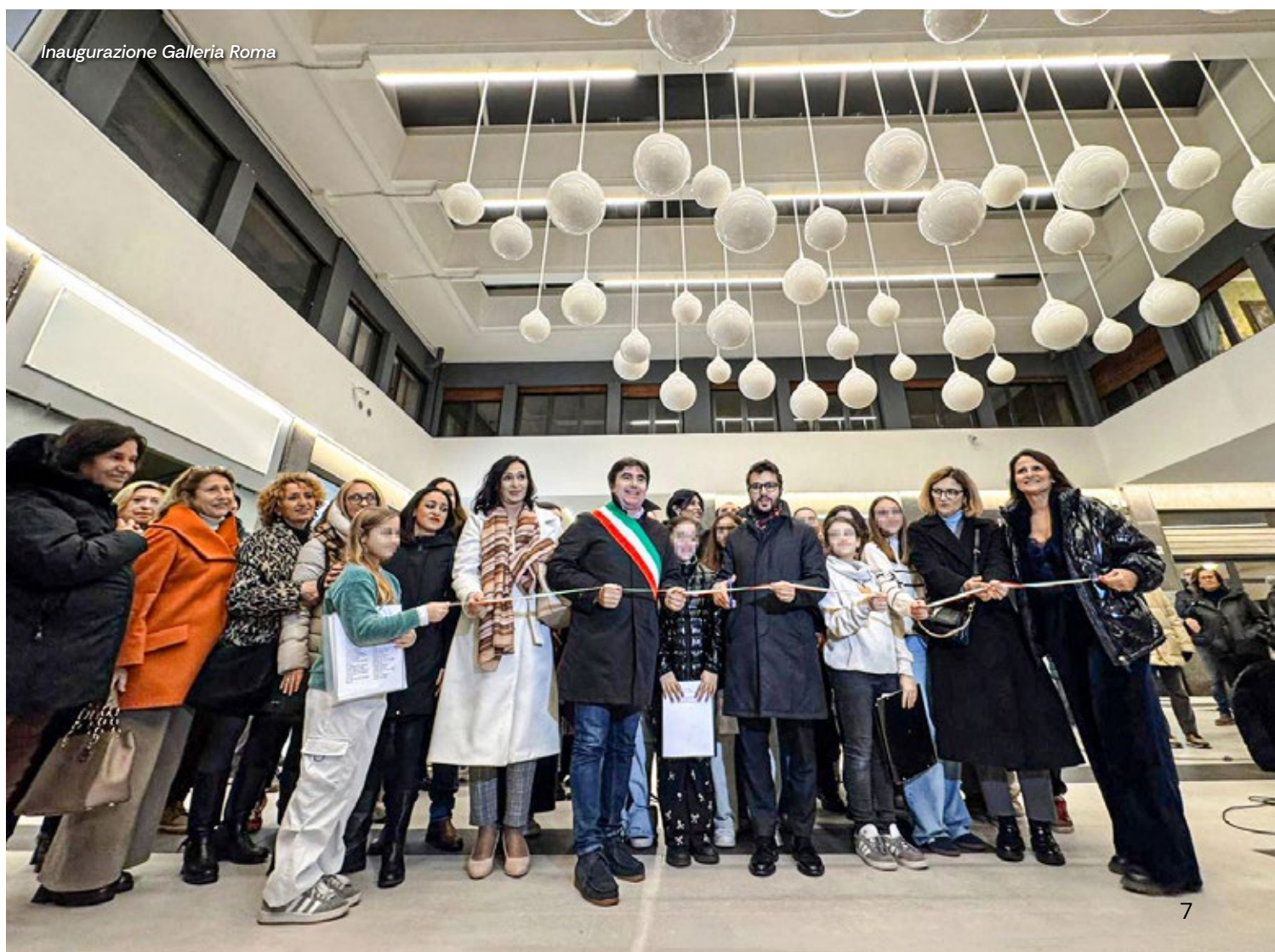
Inaugurazione Galleria Roma