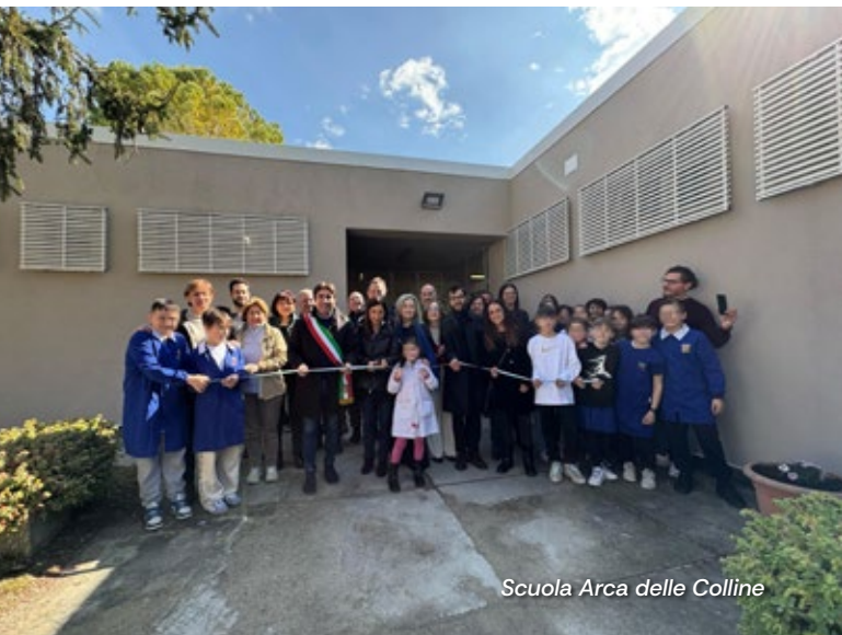
Scuola Arca delle Colline

Investire sui giovani e sul loro futuro vuol dire anche investire in scuole più sicure, funzionali e sostenibili. Con questo obiettivo Il Comune di Pesaro sta portando avanti diversi interventi di manutenzione e riqualificazione negli edifici scolastici della città. Tra i più recenti, ci sono quelli realizzati alla scuola primaria Arca delle Colline di