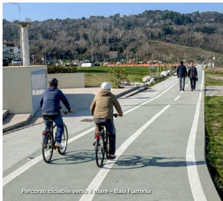
Percorso ciclabile verso il mare - Baia Flaminia

I lavori realizzati hanno previsto la riqualificazione e la messa in sicurezza del percorso ciclopeditonale che da viale Parigi porta a Lido Pavarotti, attraverso la ricollocazione del Monumento ai Tre Martiri; la demolizione della vecchia rampa usata impropriamente da auto e furgoni e la creazione di un nuovo accesso alla pista ciclopeditonale riservato ai mezzi di emergenza hanno reso l'area più ordinata e decorosa; un nuovo camminamento in cemento armato che costeggia la ciclabile; la sistemazione del verde pubblico; una nuova e bellissima passerella in legno che collega alla battigia per consentire un migliore accesso a tutti coloro che frequentano la spiaggia libera e una fruizione dell'area anche alle persone con disabilità e famiglie con carrozzine. Nel progetto che il Comune di Pesaro si è aggiudicato insieme a Ente Parco San Bartolo, Lega Navale di Pesaro e Cooperativa La Macina Terre Alte, rientra anche l'acquisto di una carrozzina che permette alle persone con disabilità di recarsi in mare (è possibile richiederla alla Scuola di Mare della Lega Navale).