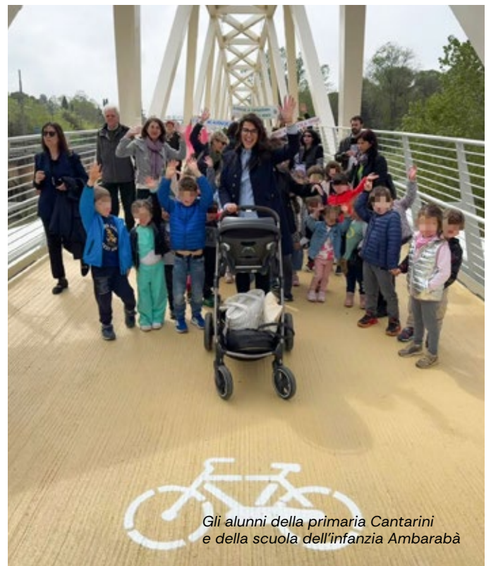
Gli alunni della primaria Cantarini e della scuola dell'infanzia Ambarabà

coesione, dialogo e sostenibilità; capace di migliorare la qualità della vita dei cittadini e di offrire uno spazio di relazione con la città e con la natura circostante.