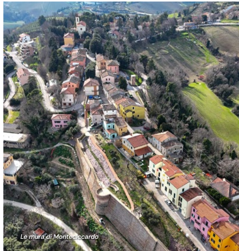
Le mura di Monteciccardo

Le mura di Monteciccardo tornano a raccontare la storia del territorio, grazie all'intervento di recupero voluto dal Comune di Pesaro e dal Municipio. Una riqualificazione che, non solo ha restituito alla comunità uno spazio identitario, ma lo ha trasformato in un luogo di incontro, socialità e cultura, destinato a ospitare eventi, mostre all'aperto e momenti di aggregazione già da questa estate. I lavori, realizzati in meno di un anno, hanno previsto il consolidamento strutturale della cinta muraria, il ripristino del percorso pedonale e la ricostruzione della parte sommitale sul lato sud-est del castello. È stata curata molto anche la fruibilità dell'area, collegata alla piazza e al centro del borgo con un itinerario panoramico che segue la storica passeggiata lungo le mura. La nuova illuminazione, invece, valorizza il complesso, rendendolo accessibile e suggestivo anche di sera. L'intervento, del valore di circa 800 mila euro finanziati da Comune e Regione Marche, ha inoltre permesso di recuperare la porzione di mura vicino all'antica porta d'accesso, in passato crollata e invasa dalla vegetazione. Dopo Monteciccardo, sono in corso lavori sulle mura di Casteldimezzo e Candelara.