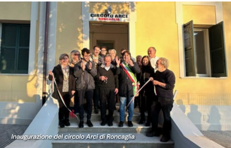
Inaugurazione del circolo Arci di Roncaglia

Favorire la socialità e la coesione tra residenti , offrendo spazi sicuri, accessibili e sostenibili per tutti, anche e soprattutto nelle zone più periferiche della città.