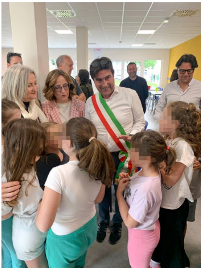
Sotto a destra: gli interni della mensa scolastica della Pirandello

Bambine e bambini da zero a sei anni condividono spazi, attività ed esperienze; educatori e insegnanti lavorano insieme con una visione comune, costruita con il lavoro del Coordinamento pedagogico del Comune di Pesaro e dell'istituto comprensivo Dante Alighieri. Accanto all'innovazione educativa, il progetto si distingue anche per le scelte architettoniche e ambientali fatte dall'Amministrazione. "Il Faro" è un edificio nZEB (nearly Zero Energy Building); la struttura è interamente realizzata in legno, con materiali innovativi e a basso impatto ambientale, ed è dotata di impianti ad alta efficienza che producono più energia di quanta ne consumano mediamente.