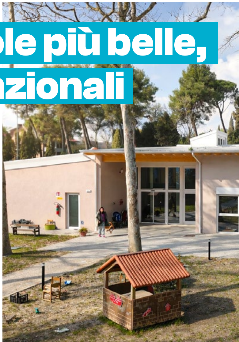
Sopra: il cortile del polo per l'infanzia "Il Faro"

Investire nei servizi educativi e nella qualità degli spazi dedicati ai più piccoli. È una delle direttrici su cui l'Amministrazione comunale continua a lavorare, programmare e intervenire. Un impegno che negli ultimi anni si è tradotto in numerosi cantieri di edilizia scolastica e in nuovi servizi per le famiglie, con risultati concreti già visibili in città. Tra questi, il Polo dell'infanzia 0-6 anni "Il Faro" realizzato in via Rigoni nel quartiere Soria. La struttura ha aperto le porte alle bambine e ai bambini nel settembre 2025, accogliendo alunni del nido Alberone (nei cui spazi il Comune ha deciso di realizzare il futuro Centro per l'Autismo) e della scuola dell'infanzia Skarabokkio. L'intervento dell'Amministrazione comunale ha un valore complessivo di 3,7 milioni di euro e ha permesso di realizzare il primo polo educativo 0-6 anni della provincia, in cui nido e scuola dell'infanzia convivono nella stessa struttura. È proprio questa integrazione a rappresentare il cuore della "rivoluzione educativa" del nuovo polo.