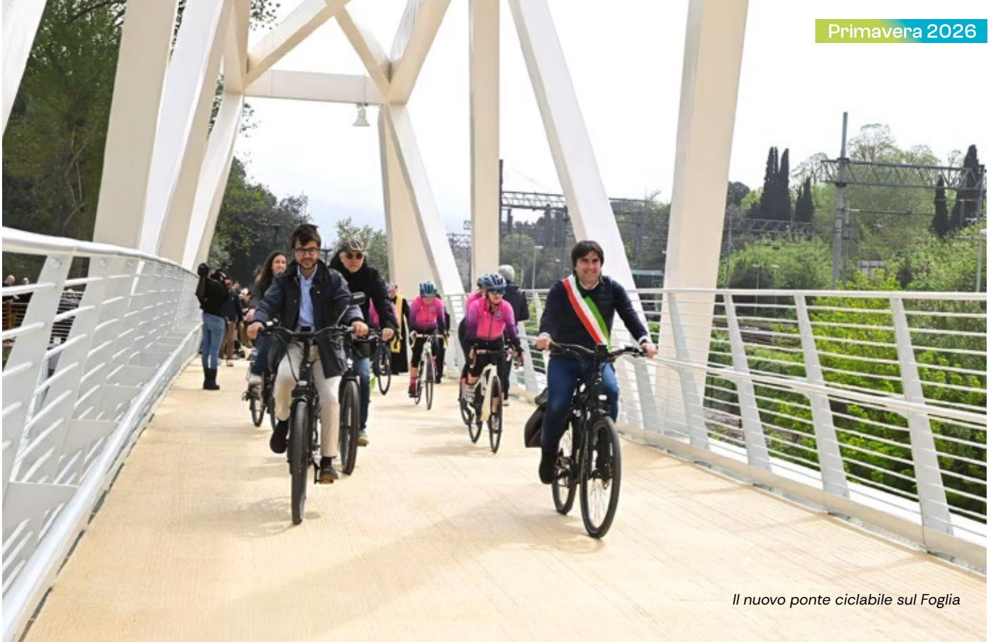
Il nuovo ponte ciclabile sul Foglia