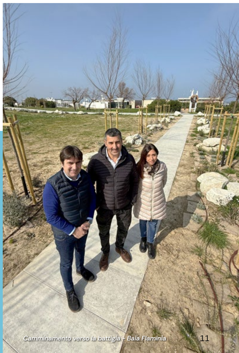
Camminamento verso la battigia - Baia Flaminia