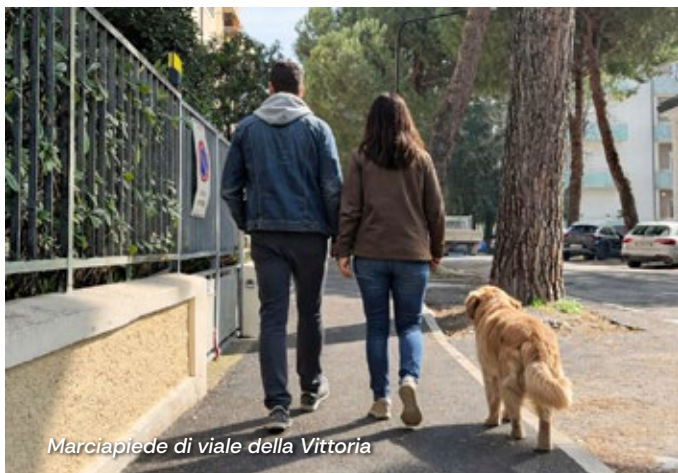
Marciapiede di viale della Vittoria

Dal mare ai Quartieri meno centrali: più sicurezza e decoro per chi cammina