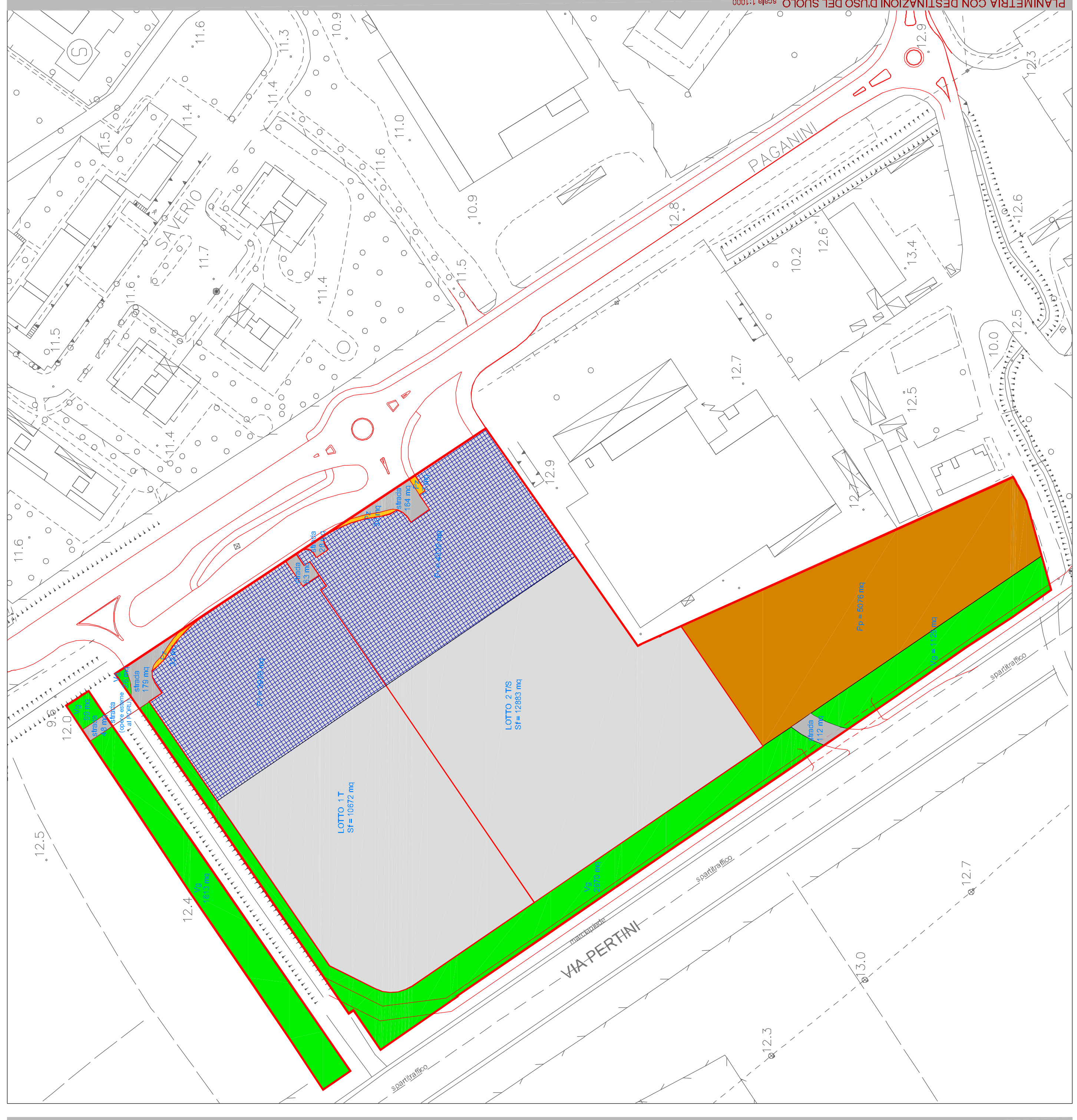
2 via paganini